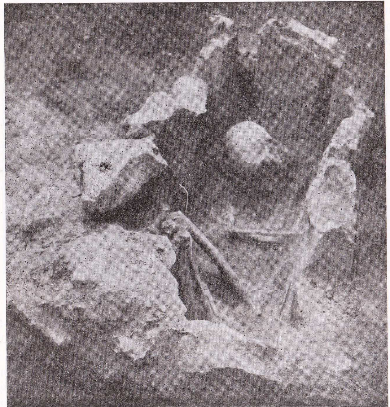
Εἰκ. 4. Ὁ εἰς τῶν μεσοελλαδικῶν τάφων μετὰ τοῦ ἐν αὐτῷ νεκροῦ.

Left beside the public road Pteleos - Saint Theodore at kilometer point 4 from high school Grammatikeio Pteleos, in (hill) 'Gritsa' Pteleos Magnesia Greece location, excavated in 1953, by archaeologist Nicholas M. Verdelis the expense of the Archaeological Society of Athens, vaulted ( tholos ) Mycenaean tomb.