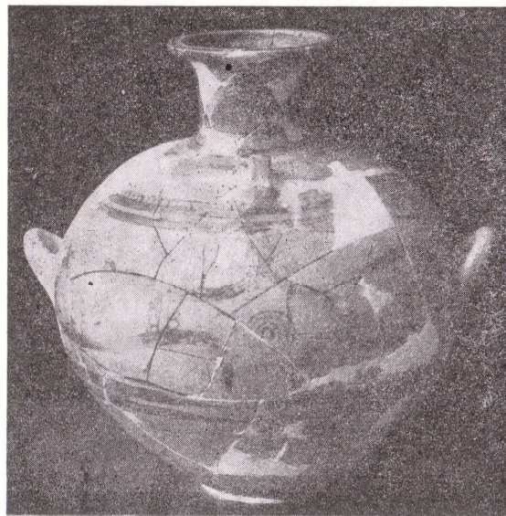
Εἰκ. 2. Ἀγγεῖον σχήματος ὑδρίας ἐκ τοῦ θολωτοῦ τάφου.